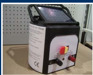
Opcija: SOLARNO NAPAJANJE

svaki pokušaj prodora, kontroler beleži i prosleđuje gde treba.